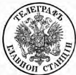
N o . 2.

perk van 1855 tot 1860 geweest 19 pCt. en in het driejarig tijdvak 1858—1860, vergeleken bij dat van 1855—1857, 10 pCt.