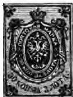
N o . 1.

De vermeerdering is gedurende het vijfjarig tijd-