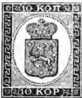
N o . 5.