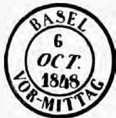
Fig. 10. Oblitération de Bale.

chent pas le filet du cadre intérieur, bien que celle de gauche en soit extrêmement rapprochée.