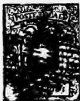
Fig 30 Faux N° 3