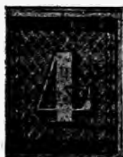
Fig. 1 — Reproduction d'un 4 rappen neuf

Les timbres de Zürich furent lithographiés sur papier assez épais; le dessin primitif des 5 types fut reporté sur la pierre, de manière à faire 10 rangées de 10 timbres, la feuille se composait donc