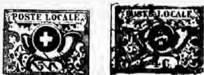
Fig. 27 et 28.

a) Il n'y a pas de point après LOCALE ; le petit ornement sous l' L est traversé par la ligne horizontale.