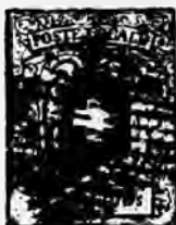
Fig 33 Faux N° 3