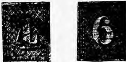
Fig. 7 et 8

GRUPE IX. — C'est la falsification la plus réussie et par conséquent la plus dangereuse, qui ait été exécutée. Elle sort de la même maison qui fabrique les faux du groupe IV.