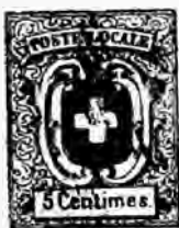
Fig. 2 o Authentique.