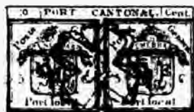
Fig 19. — Reproduction d'un Faux.

f) La partie gauche de la banderolle est à un millimètre du cadre; la partie droite touche le