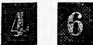
Fig. 5 et 6. — Faux du groupe I, coins grattés.

e) Impression trop claire, le fond de lignes obliques est trop fin et les groupes de 4 lignes trop rapprochés les uns des autres.