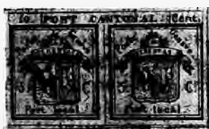
Fig. 18. — Reproduction en simili-gravure d'un double Genève, neuf.

Le P de PORT a, à sa base, un trait horizontal qui touche presque au trait vertical qui est à sa gauche; le T de PORT est à 3 millim. du C de CANTONAL; le trait qui le barre en bas est plus long à droite qu'à gauche. Le premier A de ce dernier