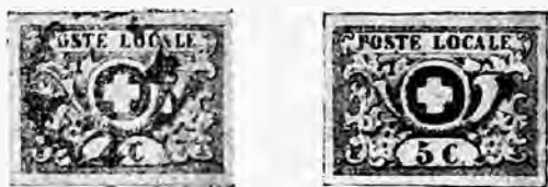
Fig. 25 et 26 Reproduction d'originaux.

En haut dans un cartouche s'étale l'inscription POSTE LOCALE , suivie d'un petit point, en bas, en dessous du cor, la valeur 4 ou 5. L'impression est noire sur papier blanc. Les planches furent ainsi constituées :