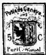
Fig. 24. Faux du type VI

n) Il y a un gros point après le C. Oblitéré avec une imitation de la rosette de Zurich en rouge ou noir, ou une grille formée de lignes parallèles rouges.