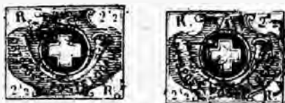
Fig. 16 et 17. — Faux des types V et VI.

Type I. — Ce faux se décèle parce qu'il est très mal exécuté, comme on peut s'en rendre compte par les différences considérables qu'il a avec les authentiques.