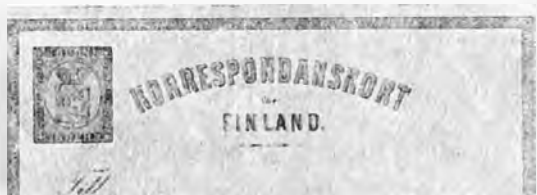
Nr. 1 und 2