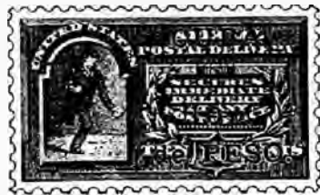
1899. Lettres express, surcharge rouge, piqué.