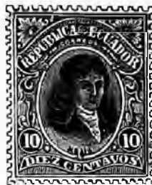
1899. Effigies variées, C sur B, piqués.