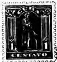
1899. Pour lettres express C sur B, piqué.