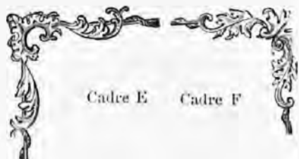
Cadre E Cadre F

Nos Neuves. Oblitérés 8c. cad. B 15 c. blanc . . » 60 » 05