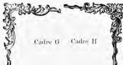
Cadre G Cadre H

1874. Même genre, sans avis sur les côtés.