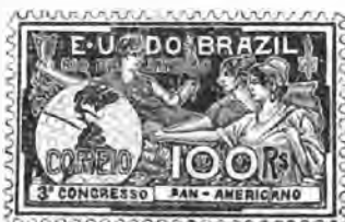
238. 100 reis rose. . . . . » » » » 239. 200 » bleu. . . . . » » » » »

1906. Timbres commémoratifs du troisième congrès panaméricain, Déesse et deux Libertés, oblongs, dentelés.