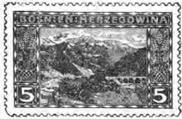
54. 5 heller vert foncé. . . » 15 » »