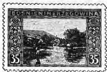
Nos. Neufs. Oblitérés. 60. 35 heller vert bleu . . . » 60 » »