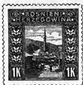
Nos. Neufs. Oblitérés. 61. 1 krone brun carminé 1 50 » »