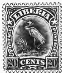
115. 20 c. orange et noir 1 f 50 " »