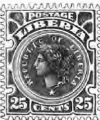
116. 25 " bleu et gris . 1 f 90 " »