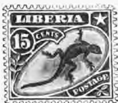
114. 15 c. violet et vert foncé . . . 1 f 45 " »