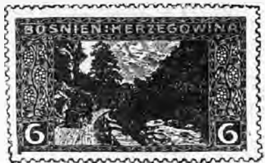
55. 6 heller brun rouge. . . » 15 » »