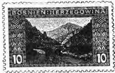
56. 10 heller carmin. . . . » 20 » »