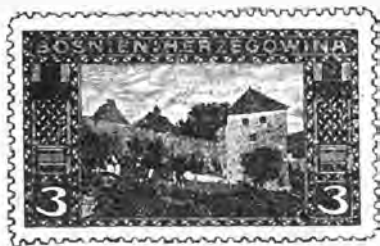
53. 3 heller jaune olive. . . » 10 » »