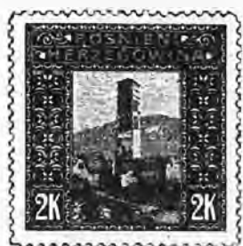
65. 2 kronen vert olive . . . 3 50 » » »