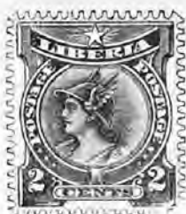
N os Neufs. Oblitérés. 111. 2 c. rose et noir . . . » 20 " »