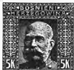
66. 5 kronen bleu foncé . . . 7 50 » » La série des 9 premières valeurs. . . . » » » 85 La série complète des 16 valeurs. . . . » » 7 50