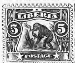
112. 5 c. bleu ciel et noir . . . » 40 " »