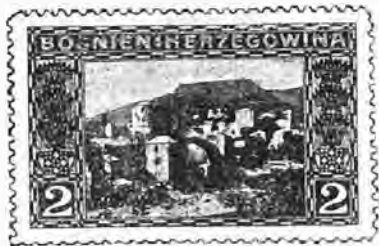
52. 2 heller violet. . . . . » 10 » »