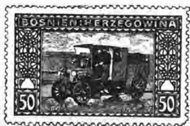
63. 50 heller violet . . . » 80 » »