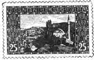
58. 25 heller bleu clair. . . » 40 » »