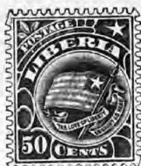
N os Neufs. Oblitérés 117. 30 c. violet . . . 2 f 25 " » 118. 50 " vert foncé et noir . . . 3 f 75 " »