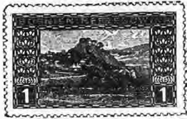
51. 1 heller gris. . . . . » 05 » »

1906. Vues diverses et effigie de face de l'empereur François-Joseph au 5 k. deux formats, dentelés.