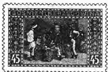
62. 45 heller vermillon . . . » 75 » »