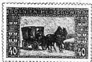
61. 40 heller orange . . . » 70 » »