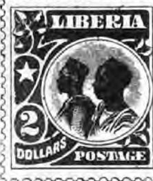
120. 1 doll. rose et gris . 7 f 50 " » 121. 2 " vert foncé et noir . . . 15 f " » »