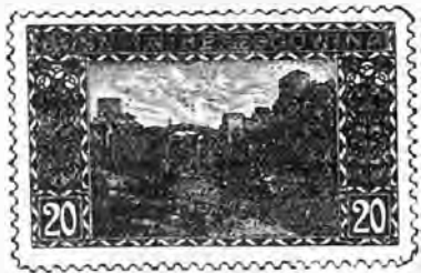
57. 20 heller brun foncé. . » 35 » »