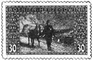
59. 30 heller vert clair. . . » 50 » »