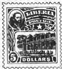
122. 5 doll. brun lilas et noir . . . 37 f " » »