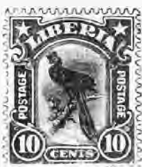
113. 10 c. brun lilas et noir . . . » 75 " »