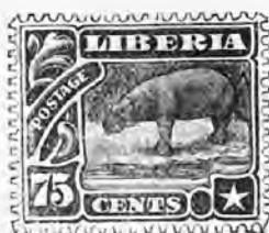
119. 75 c. brun et noir. 5 f 75 " »